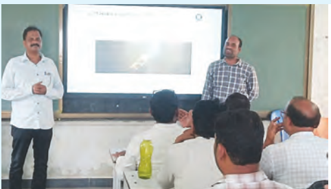
ఎన్యూఐ రేటర్లకు అవగాహన కల్పిస్తున్న మాస్టర్ ట్రైనర్లు

ఉప్పునుతల, ఏప్రిల్ 28 ప్రభాతవార్త : జనగణనలో ఎలాంటి పొరపాట్లు జరగకుండా జనగణన మండల తహశీల్దార్ ఆధ్వర్యంలో సునీత సూచించారు. భారతదేశ జన గణన సేకరణ 2027లో భాగంగా మొదటి విడత మే11నుంచి జూన్ 9వరకు నిర్వహించబోయే కార్యక్రమానికి సంబంధించి నియమితులైన ఉప్పునుతల మండల ఎన్యూఐ రేటర్లకు, సూపర్వైజర్లకు మొదటి విడత శిక్షణ సాధిక పీఎం శ్రీ జిల్లా పరిషత్ ఉన్నతపాఠశాలలో నిర్వహించారు. ఈశిక్షణలో భాగంగా రెండో రోజైన