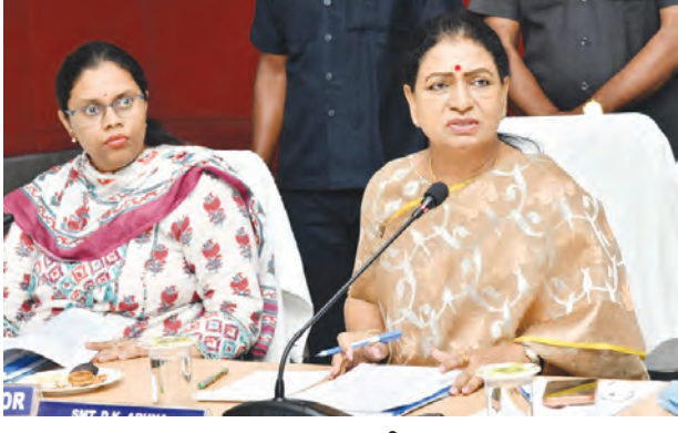
మాట్లాడుతున్న ఎంపి డి.కె అరుణ

సమస్య లేదని, ఆయిల్ ఫాం సాగుపై ఆదర్శ రైతులకు అవగాహన కార్యక్రమాలను చేపట్టాలని ఎం.పి.విశ్వేశ్వర్ రెడ్డి జిల్లా ఉద్యాన అధికారికి సూచించారు. కూరగాయలు ఎక్కువగా సాగు చేసే రైతులకు కూరగాయలు నిల్వ చేసుకుని మార్కెట్ చేసుకునే విధంగా మినాళ్ళు కార్యక్రమాలు చేపట్టాలని జిల్లా ఉద్యాన అధికారి వేణు గోపాల్ ను ఎంపి డి.కె అరుణ సూచించారు. ఉపాధి హామీ పథకం కింద చేపట్టిన కమ్యూనిటీ డ్రైనేజీ ఎండ్ పాయింట్ లో సోకే పిల్ల 353 మంజూరు చేయగా 17 మాత్రమే పూర్తి చేసినట్లు డి.కె.ఎ. వివరించారు. కమ్యూనిటీ సోకే పిల్ల వెంటనే పూర్తి చేయాలన్నారు. అంగన్వాడీ కేంద్రాలను పటిష్టంగా నిర్వహించాలని, భవనాలు లేక బయట కూర్చుంటున్నారని, అంగన్వాడీ నిర్మాణంలో ఉన్నవి త్వరగా పూర్తి చేయాలని, తర్వాత వి.టి. భవనాలు నిర్మాణం పూర్తి చేయాలని ఎం.పి. డి.కె. అరుణ అడిగారు. సర్వే ద్వారా జిల్లాలో పెండింగ్ పింఛనులు గురించి ఎంపి డి.కె అరుణ ప్రస్తావించారు. ప్రతి నెల యుడీబి క్యాంపులు నిర్వహించి సర్టిఫికేట్లు మంజూరు చేసి వితంతువులు పెన్షన్ రాకుండా తిరుగుతున్నారని, పరిశీలించాలని ఎంపి డి.కె అరుణ సూచించారు. మైనింగ్ గురించి సమీక్షించా ఆక్రమణకు గురించి ఎంపిలు అరుణ, కొండా తిరుగుతున్నారని, పరిశీలించాలని ఎంపి డి.కె అరుణ సూచించారు. ఆక్రమణకు తప్పకాలు జరుగుతున్నాయని, ఆక్రమణ మైనింగ్ వలన వేరే వేరాలు పెరుగుతున్నాయని, గ్రామంలో కొట్లాటలు జరుగుతున్నాయని, వెంటనే క్లీర్ స్టాయిల్ మైనింగ్ అధికారులు చర్యలు చేపట్టాలని ఎంపిలు అరుణ సూచించారు. ఆక్రమణ మైనింగ్ నిరోధానికి పటిష్ట చర్యలు తీసుకోవాలని సూచించారు. ఎన్.హెచ్ ద్వారా చేపట్టిన భారత్ మాట మహబూబ్ నగర్ మునిసిపాలిటీ పరిధిలో అలైన్ మెంట్ మార్చడంలో స్థానికులు వ్యతిరేకిస్తు