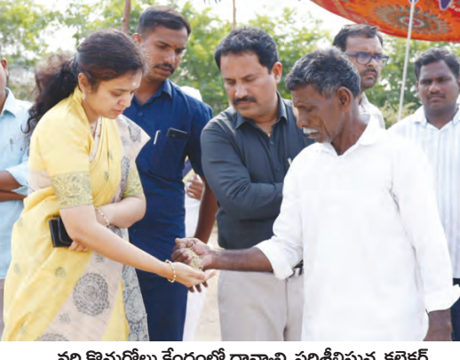
వలి కొనుగోలు కేంద్రంలో ధాన్యాన్ని పరిశీలిస్తున్న కలెక్టర్

నారాయణపేట, ఏప్రిల్ 28 ప్రభాతవార్త : నారాయణపేట మండలం సింగారం పరి ధాన్యం కొనుగోలు కేంద్రాన్ని జిల్లా కలెక్టర్ సీహెచ్.ప్రియాంక పరిశీలించారు. కేంద్రానికి ఇప్పటివరకు వచ్చిన ధాన్యం పరిమాణం, తేమ శాతం గురించి అధికారులను అడిగి తెలుసుకున్నారు. ధాన్యం తేమ శాతాన్ని స్వయంగా తనిఖీ చేశారు. ఇటీవల కురిసిన తేలికపాటి వర్షానికి ధాన్యం తడిసిందా అని ఆరా తీశారు. ధాన్యం సేకరణకు అవసరమైన తేమ కొలిచే యంత్రాలు, టార్పాలిన్లు, ఎలక్ట్రానిక్ కాంట్రోలు, గన్లు బ్యాగులు అందుబాటులో ఉంచుకోవాలని సూచించారు. అవసరమైన సామగ్రి కోసం అందెంట్లు పెట్టి వెంటనే తెప్పించుకోవాలని ఆవేదించారు. మిల్లలకు చేసిన ధాన్యాన్ని తరలించారు. రైతులతో మాట్లాడి వారు కేంద్రానికి ఎప్పుడు వచ్చారు, ఎన్ని బాగులు తీసుకువచ్చారో తెలుసుకున్నారు. సన్న రకం, దొడ్డు రకం వడ్లను వేరువేరుగా నిల్వ చేసే మిల్లలకు అందెంట్లు సూచించారు. కేంద్రాల్లో కొనుగోలు చేసిన ధాన్యాన్ని ఆయా రైస్ మిల్లలకు తరలించే