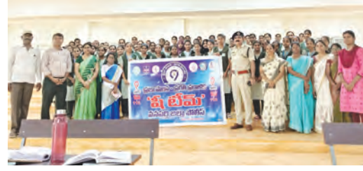
నర్సింగ్ విద్యార్థులకు అవగాహన కల్పిస్తున్న డిఎస్పి

వనపర్తి డిస్కంపెన్సీ బాలాజీ నాయక్ యువతను పట్టిపీడిస్తున్న డ్రగ్స్ మహమ్మారిపై అప్రమత్తం కావాలి విద్యార్థుల భద్రతకు అవగాహన ప్రధాన రక్షణ మార్గం బాలల భద్రత, మాదకద్రవ్యాల వ్యతిరేక వారోత్సవాలలో 2వ రోజు కార్యక్రమం నర్సింగ్ విద్యార్థులకు లింగ సమానత్వం, సమ్మతి, సైబర్ నేరాలపై అవగాహన