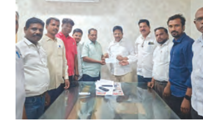
యెన్నో హెల్త్ కిట్..

జర్నలిస్టు వృత్తి అనేది కత్తి మీద సాము లాంటిది. సమయంతో సంబంధం లేకుండా పరుగులు పెట్టే పరిస్థితుల్లో ఏదైనా జరగరాని ఆపద సంభవించే అయ్యా అనే వాళ్ళు తప్ప ఆడుకునే చేతులు అందరికీరావు. మూడు దశాబ్దాలుగా జర్నలిస్టుల పరిస్థితులను, తాను ప్రత్యక్ష రాజకీయంలోనూ వారి సాధక బాధకాలను దగ్గరుండి చూసి తన వంతుగా, సొంతంగా ఎంతో కొంత మేలు తల పెట్టాలని సమర్థితంతో శ్రీకారం చుట్టిన అడ్వకేట్ కార్యక్రమం ప్రతినెలా తన శీతం నుంచి రూపాయిలు లక్ష జర్నలిస్టుల సంక్షేమానికి అందజేస్తానని