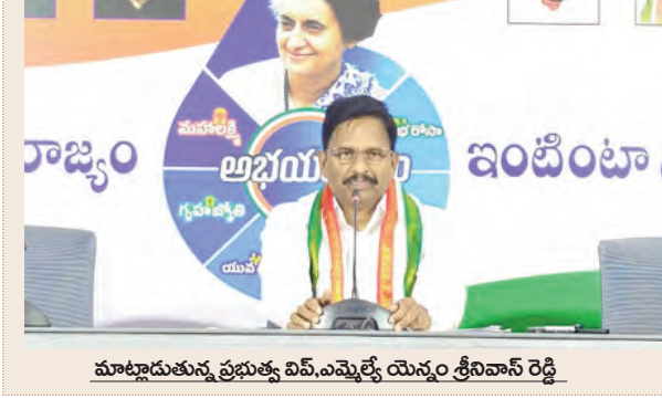
మాట్లాడుతున్న ప్రభుత్వ వివ్, ఎమ్మెల్యే యెన్నో శ్రీనివాస్ రెడ్డి