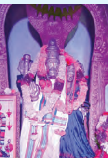
శ్రీ లక్ష్మీనరసింహ స్వామి మూల విరాళం