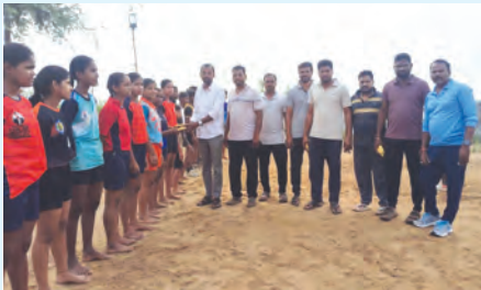
క్రీడాకారులకు ఆర్థిక సహాయం.