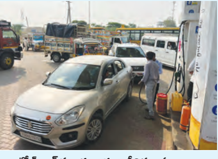
పెట్రోల్ బండ్ల ముందు బారులు తీరిన వాహనాలు

ధన్వాడ, ఏప్రిల్ 28 ప్రభాతవార్త : ధన్వాడ మండల కేంద్రంలో పెట్రోల్ కొరత కారణంగా వాహనదారులు తీవ్ర ఇబ్బందులు ఎదుర్కొంటున్నారు. గత కొద్ది రోజులుగా పెట్రోల్ అందుబాటులో లేకపోవడంతో ప్రజలు ఇందనం కోసం తిరుగుతూ అవస్థలు పడుతున్నారు. మంగళవారం ఉదయం భారత్ పెట్రోల్ బండ్లకు పెట్రోల్ సరఫరా రావడంతో వాహనదారులు ఒక్కసారిగా అక్కడికి చేరుకున్నారు. బండ్ల వద్ద పెద్ద ఎత్తున వాహనాలు బారులు తీరడంతో కొంతసేపు ట్రాఫిక్కు అంతరాయం కలిగింది. పెట్రోల్ కోసం గంటల తరబడి వేచి చూద్దాల్సి వచ్చిన వాహనదారులు ఆవేదన వ్యక్తం చేస్తున్నారు. కొంతమంది ఉదయం నుంచే లైన్లో నిలబడి ఇందనం పొందేందుకు ప్రయత్నించారు. స్థానికులు మాట్లాడుతూ తరచూ ఇలాంటి కొరతలూ రావడం వల్ల రోజువారీ వసతుల ఇబ్బందులు కలుగుతున్నాయని తెలిపారు. ఉద్యోగాలకు వెళ్లేవారు, రైతులు, వ్యాపారులు ఇందనం తీరే ఇబ్బందులు పడుతున్నారని చెప్పారు. పెట్రోల్ సరఫరా నిరంతరం ఉండేలా అధికారులు చర్యలు తీసుకోవాలని ప్రజలు కోరుతున్నారు.